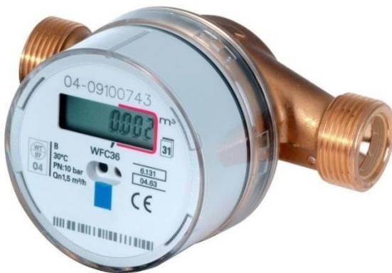
Afbeelding 1 Warmwatermeter

Het scherm op de watermeter verspringt automatisch van de actuele meterstand (a) naar de segmenttest (b) en weer terug (afbeelding 2). Bij de segmenttest is te zien of het display goed functioneert en alle segmenten waaruit de cijfers zijn opgebouwd werken.